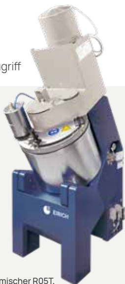
Labormischer R05T, Nennfüllung 40 Liter